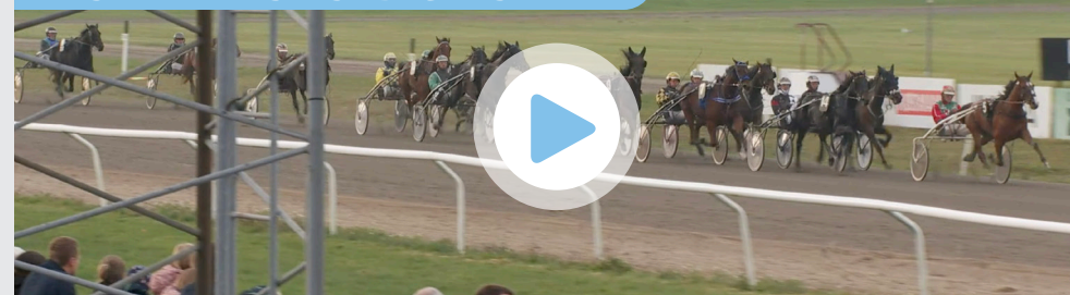
På den elektroniske udgave klikker du på billedet for at se videoen.